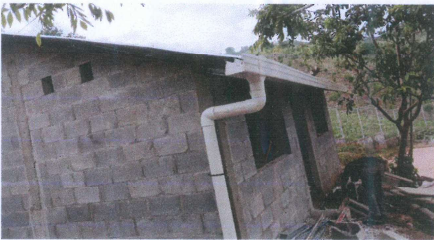
Foto 3: Vista frontal de la instalación de bajada de agua pluvial.