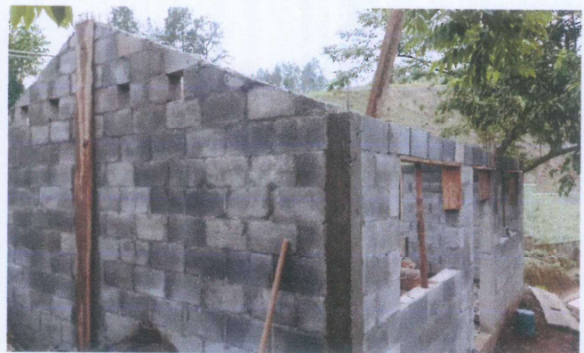
Foto 4: Avance en el mejoramiento de la infraestructura de la cocina.

Observación: Si es necesario se pueden agregar hojas adicionales y actualizar el número de hojas.