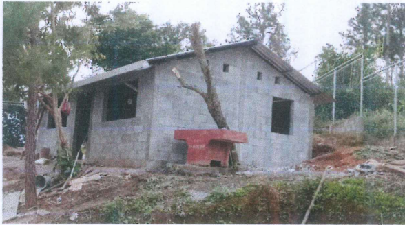
Foto1: Instalación de canal de agua pluvial