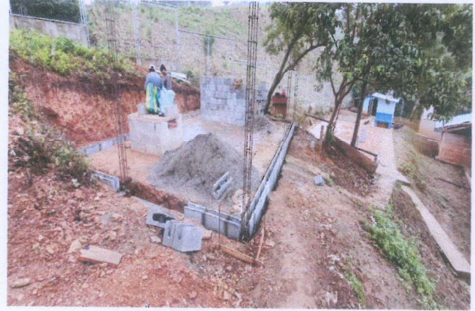
Foto 2: Colocación de cemento corrido, estructura de columnas y fundición de primera solera.