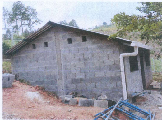
Foto 4: Se continúa la colocación de 7.3 metros lineales de canal.

Observación: Si es necesario se pueden agregar hojas adicionales y actualizar el número de hojas.